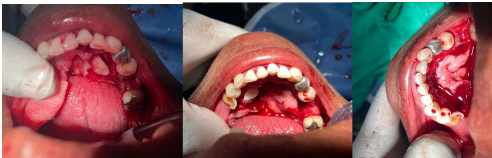
Fig. 4 Desprendimiento del lado izquierdo y derecho/ Reposición de colgajo.

Luego de esto con una fresa 702 y la pieza de alta seccionamos el torus, posterior a esto se le pego un cincel para el desprendimiento de manera bilateral