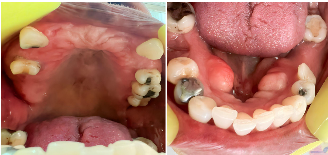
Fig. 2 Fotografía intraoral de la arcada superior e inferior.

Adicionalmente se presentan dos lesiones tumorales multilobulada hipertónicas de consistencia dura no móvil en la mandíbula del lado derecho e izquierdo por lingual.